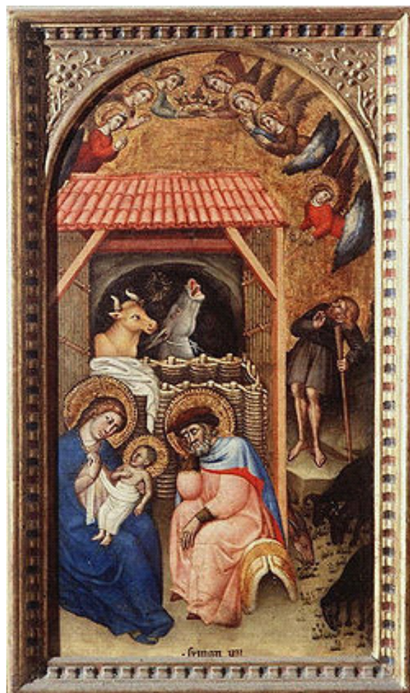
SIMONE DEI CROCIFISSI, Natività , Firenze (1380)

Auguri di Buon Natale e di Felice Anno Nuovo a tutta la Comunità Pastorale!